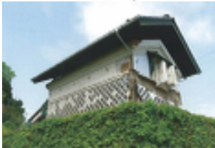
福島県南相馬市小高区天野家東倉